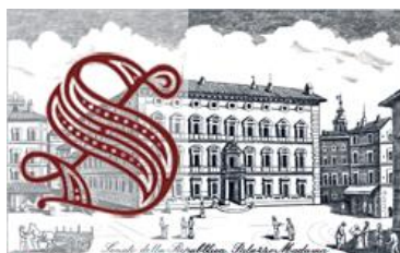
Senato della Repubblica »

(Notizie tratte dal sito del Ministero della Giustizia).