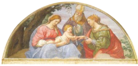
Ordine degli Avvocati di Perugia