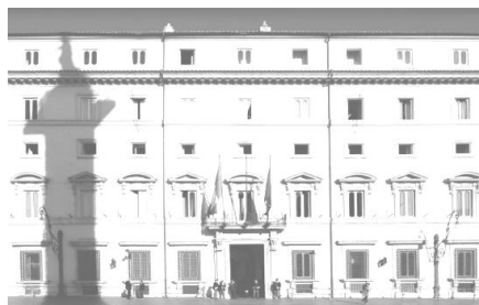
Governo - Ministero della Giustizia

Il Consiglio dei Ministri si è riunito venerdì 16 giugno 2017 ed ha approvato: